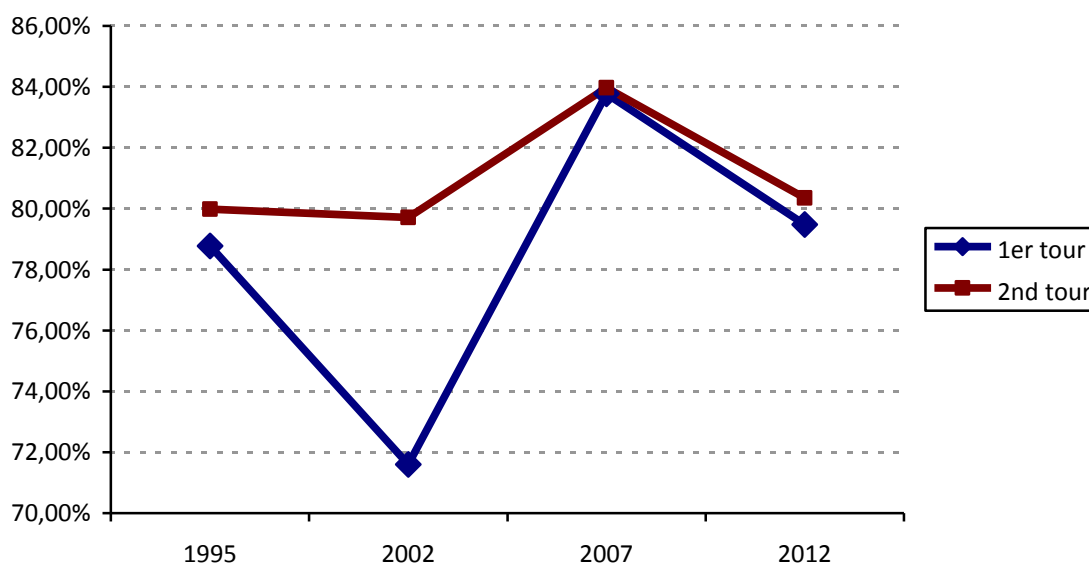
Taux de participation définitif depuis 1995 (France entière)